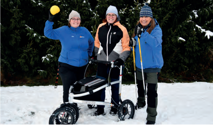
Kävelykäsipallo ja maastorollaattori ovat Aktiiviset seniorit -hankkeen kaksi uutuutta.