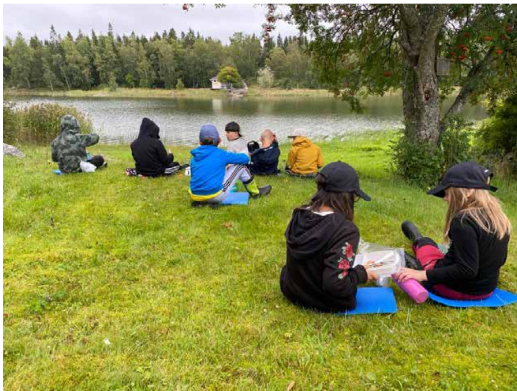
Paus efter maten och svamp- och bärplockningen i det fina vädret på Norrsundet.