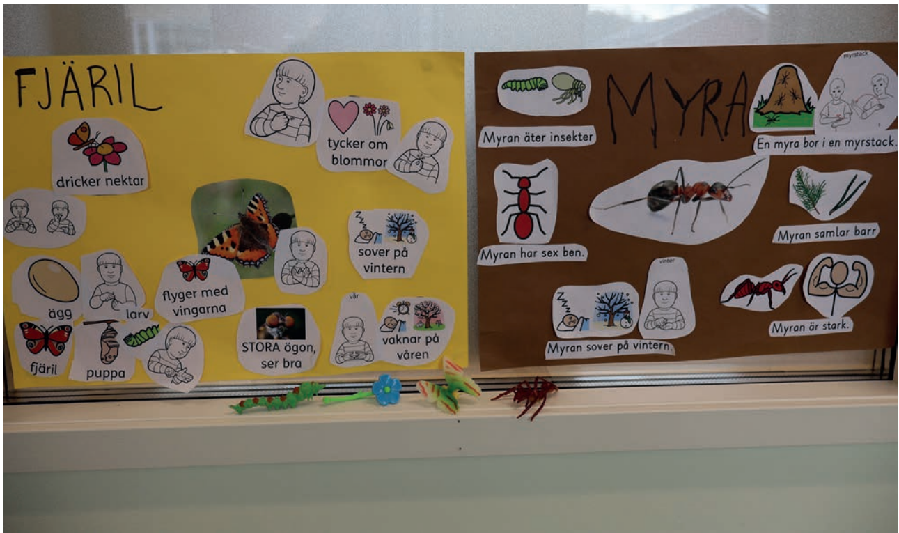
Oppilastöitä perhostesta ja muurahaisesta.

Keväällä 2021 päätettiin, että Övermalax skolaan perustetaan syksyllä 2022 pienryhmä. Pienryhmä ottaa vastaan laaja-alaisen erityisen tuen tai toiminta-alueittain järjestetävän opetuksen tarpeessa olevia oppilaita koko kunnasta. Tarve tällaiselle pienryhmälle on ollut olemassa jo monta vuotta. Maalaitelaiset oppilaat ovat voineet aiemmin käydä Vaasan kaupungin Haga skola, mutta Vaasan omat tarpeet ovat nykyään niin suuret, ettei muista kunnista ole voitu ottaa vastaan oppilaita.