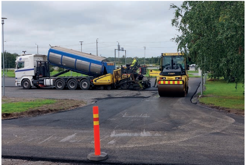
Maalahden-Korsnäsin terveyskeskuksen pysäköintialue on perusparannettu ja saanut tänä syksynä uuden asfalttipäällysteen.

rekisteröidä Maanmittauslaitokselle, ja kopio rekisteröinnistä on lähetettävä tiemestarille. Tärkeää on, että sellainen tiekunta, joka täyttää vain talvikunnossapitokriteerit eli III luokan, tekee sopimuksen vuoden 2023 aikana, koska kriteereissä päätettiin, että III luokan sopimuksia voidaan tehdä vain tänä vuonna. Tiet, jotka kuuluvat III luokkaan, eivät täytä I tai II luokan teiden vaatimuksia, mutta ovat vähintään 350 metrin pituisia viimeiselle vakitukselle asunnolle ja niiden varrella on vähintään yksi vakituinen asunto.