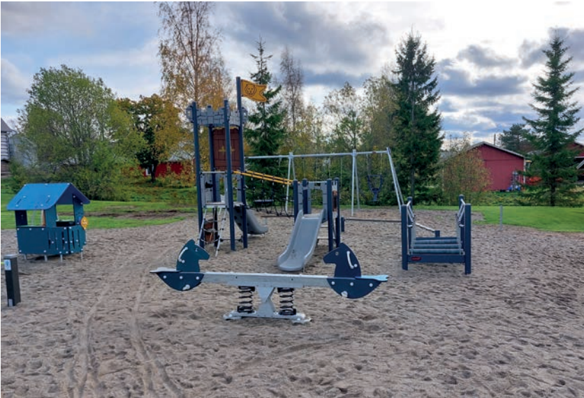
Petolahden leikkipuisto on uusittu. Hanke on toteutettu yhteistyössä Petolahden Folkhälsanin kanssa. Kunta on investoinut leikkelineisiin 20 000 euroa.