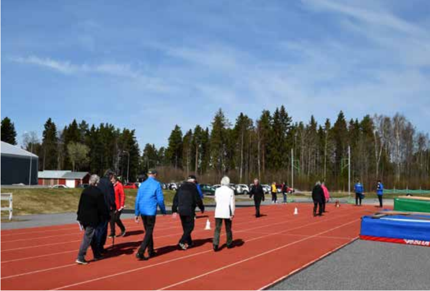
Kuva Pixnessä 10.5.2023 järjestetystä unelmien liikuntapäivästä.