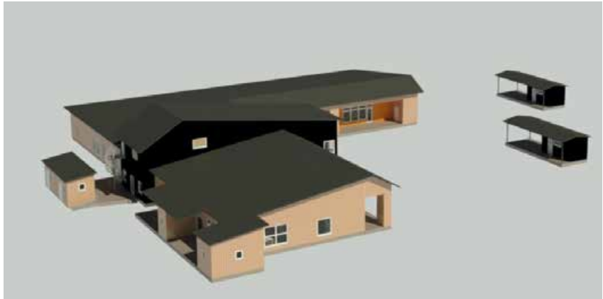
Söderfjärdsbackenin päiväkoti.

Vihdoinkin on aloitettu kävely- ja pyöräteiden suunnittelu Paxalin ja Viaksen välille ja Åminnentielle. ELY-keskus toteuttaa suunnittelun yhteistyössä Maalahden kunnan kanssa. Maastotutkimukset on aloitettu. Hankkeen tavoitteena on parantaa jalankulkijoiden ja pyöräilijöiden turvallisuutta. Tässä vaiheessa pyöräteiden rakentamiselle ei ole aikataulua, koska valtion rahoituksen on ensin oltava selvä. Maalahden kunnanvaltuusto voi tehdä päätöksen rahoitukseen osallistumisesta.