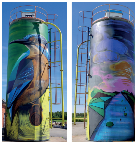
Väggmålningen vid fd. avloppsreningsverket i Åminne