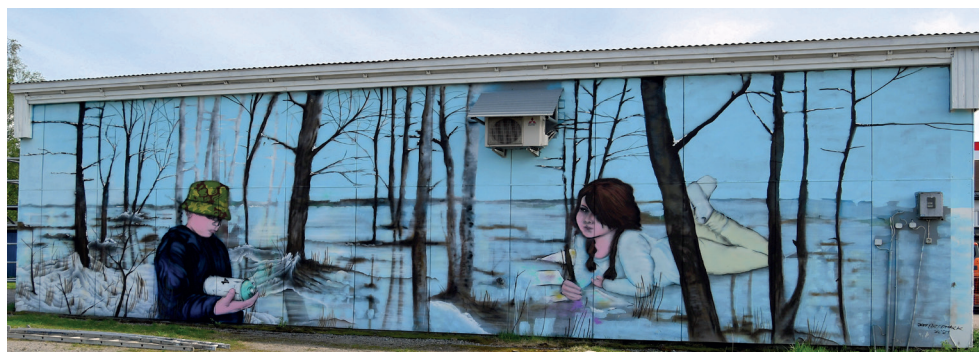
Väggmålningen i Petalax

Alla tips kan knappast förverkligas, men några enstaka kan säkert väljas ut och bli verklighet under 2022–2025. Tänk om just din idé blir en väggmålning! Tipsa oss så finns chansen!