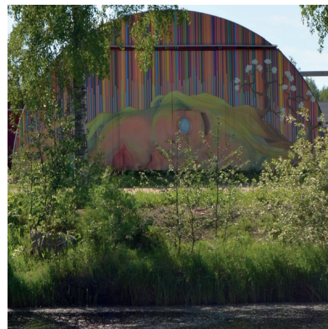
Väggmålningen vid Jarla Products mitt emot Malakta