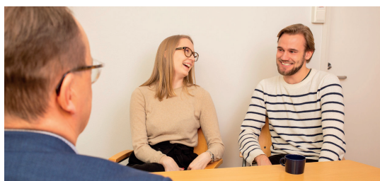
Text och foto: VASEK

Vi önskar alla en trevlig sommar! Vasaregionens Utveckling Ab VASEKs och Nyföretagscentrum Startias personal