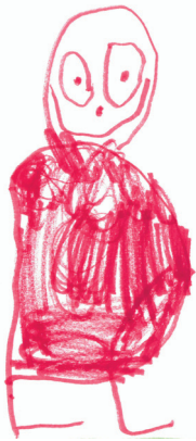
Kommunens logo för barnvänlig kommun

Den övergripande visionen i verksamhetsplanen lyder: ”Malax kommun är en barnvänlig kommun, där barn och unga mår bra. De hörs i frågor som berör dem, de känner sig delaktiga i utformandet av tjänster och det offentliga rummet och är väl medvetna om sina möjligheter att påverka.”