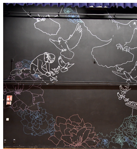
Muralmålningen vid Högstadiet i Petalax

Från tidigare finns det 12 muralmålningar i Malax kommun, så till hösten borde vi ha sammanlagt 15. På Malax kommuns webbplats under fritid och kultur finns ett dokument med alla muralmålningar inprickade på karta.